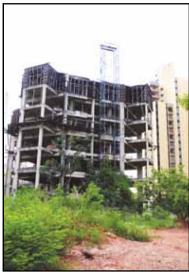
Rua Nelson Alaite 119 Mansões Santo Antonio

O condomínio residencial previa dois blocos de edificação com 15 pavimentos cada, mais cobertura, em área total de 11.741 m 2 , de propriedade da empresa Abramides Empreendimentos Imobiliários S/C Ltda. O projeto original foi aprovado em mai/95 e o alvará autorizando o início das obras foi emitido em agosto do mesmo ano. Em jan/00 uma vistoria constatou que as obras estavam paralisadas em estágio de alicerçamento do 5º andar. Apesar da área técnica da construtora ter sido intimada em out/01 a regularizar a obra, em set/07 nada havia mudado: “a obra estava abandonada e em situação precária e insegura, com madeiras caindo”, como relataram os fiscais na época. Em mar/08, o responsável técnico pelas obras foi intimado mas informou que a retomada do empreendimento implicaria em alterações no projeto aprovado em 1995, implicando na demolição da estrutura existente. Apesar de ter sido informado das providências necessárias para esta alteração, o prédio continua abandonado e a empresa não foi localizada.