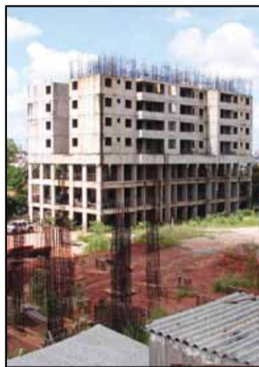
Rua Almeida Garret, 1100 Parque Taquaral /Ecolife

O Ecolife, edifício de 20 andares com vista para a Lagoa foi um projeto que causou forte polêmica no Parque Taquaral. O alvará de construção concedido com base na Lei 11.764/2003 (revogada posteriormente ao ser julgada inconstitucional), conflitava com o Plano Diretor da cidade, por ser área vetada para prédios. Desde o lançamento, no início de 2008, os moradores vizinhos contestaram na Justiça a irregularidade da obra, que foi embargada em março de 2009, quando já haviam sido concluídos quatro andares e cerca de 80% do empreendimento comercializado. Mas até hoje construtoras e Prefeitura ainda recorrem da decisão judicial, embora a Ecoesfera Empreendimentos Sustentáveis tenha anunciado a devolução do dinheiro aos compradores.