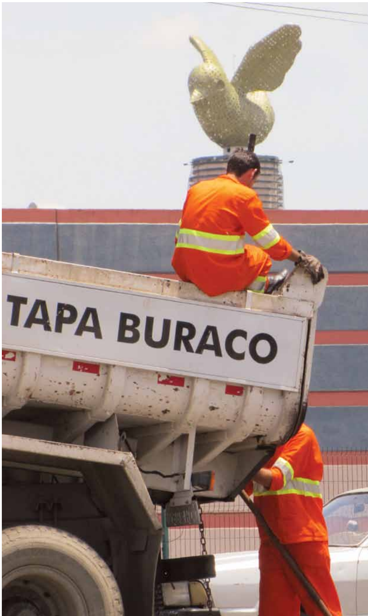
Serviço de tapa-buracos é terceirizado pela prefeitura

ANUNCIE (19) 3256-9059 www.jornalaltotaquaral.com.br