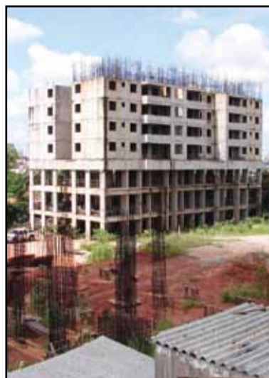
Rua Almeida Garret, 1100 Parque Taquaral /Ecolife

O Ecolife, edifício de 20 andares com vista para a Lagoa foi um projeto que causou forte polêmica no Parque Taquaral. O alvará de construção concedido com base na Lei 11.764/2003 (revogada posteriormente ao ser julgada inconstitucional), conflitava com o Plano Diretor da cidade, por ser área vetada para prédios. Desde o lançamento, no início de 2008, os moradores vizinhos contestaram na Justiça a irregularidade da obra, que foi embargada em março de 2009, quando já haviam sido concluídos quatro andares e cerca de 80% do empreendimento comercializado. Mas até hoje construtoras e Prefeitura ainda recorrem da decisão judicial, embora a Ecoesfera Empreendimentos Sustentáveis tenha anunciado a devolução do dinheiro aos compradores.