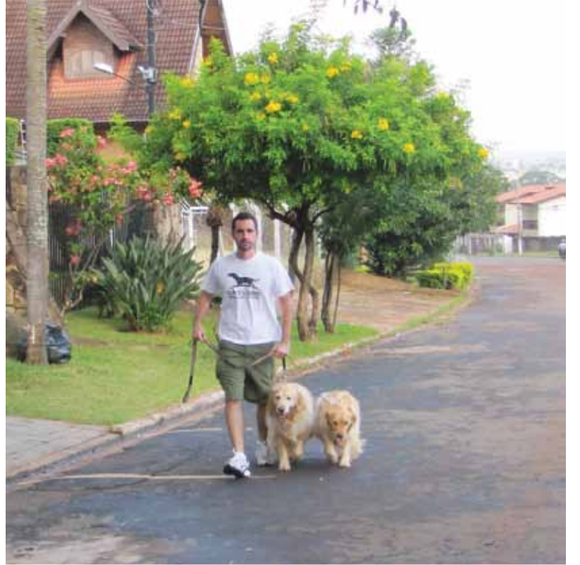
O passeio é diferente de adestramento. Os animais são levados apenas para caminhadas

A vida corrida e a sobrecarga de atividades está abrindo espaço para atuação de um novo profissional em Campinas: o passeador de cachorros (dog walker). Esse serviço é oferecido a donos de cães que não tem tempo, disposição ou condição física para a necessária rotina de exercícios com seus animais.