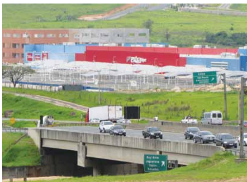
Acesso ao Extra ainda está indefinido

O projeto viário apresentado pela Prefeitura de Campinas como alternativa para abertura do Hipermercado Extra no entroncamento das rodovias SP 340 e Dom Pedro I, foi recusado pela Artesp – Agência Reguladora de Serviços Públicos Delegados de Transporte do Estado de São Paulo.