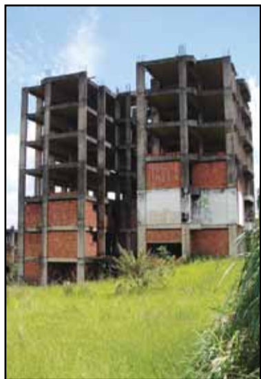
Rua Jasmin nº 250 Chácaras Primavera