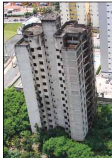
Rua Hermantino Coelho 758 Residencial Parque Primavera

foram concluídos apenas na parte estrutural. A construtora informou que a obra parou em 2004, por problemas de inadimplência. Atualmente o empreendimento busca novos investidores para dar continuidade à obra, que fica ao lado do córrego das Cobras e, segundo a Prefeitura, está fora da área de contaminação do bairro. A Construpan foi intimada em janeiro deste ano, “a colocar o imóvel em condições de segurança, estabilidade e salubridade” e o prédio interditado até que o mato, lixo e entulhos sejam removidos. Em fevereiro a empresa cortou o mato, limpou e cercou a área.