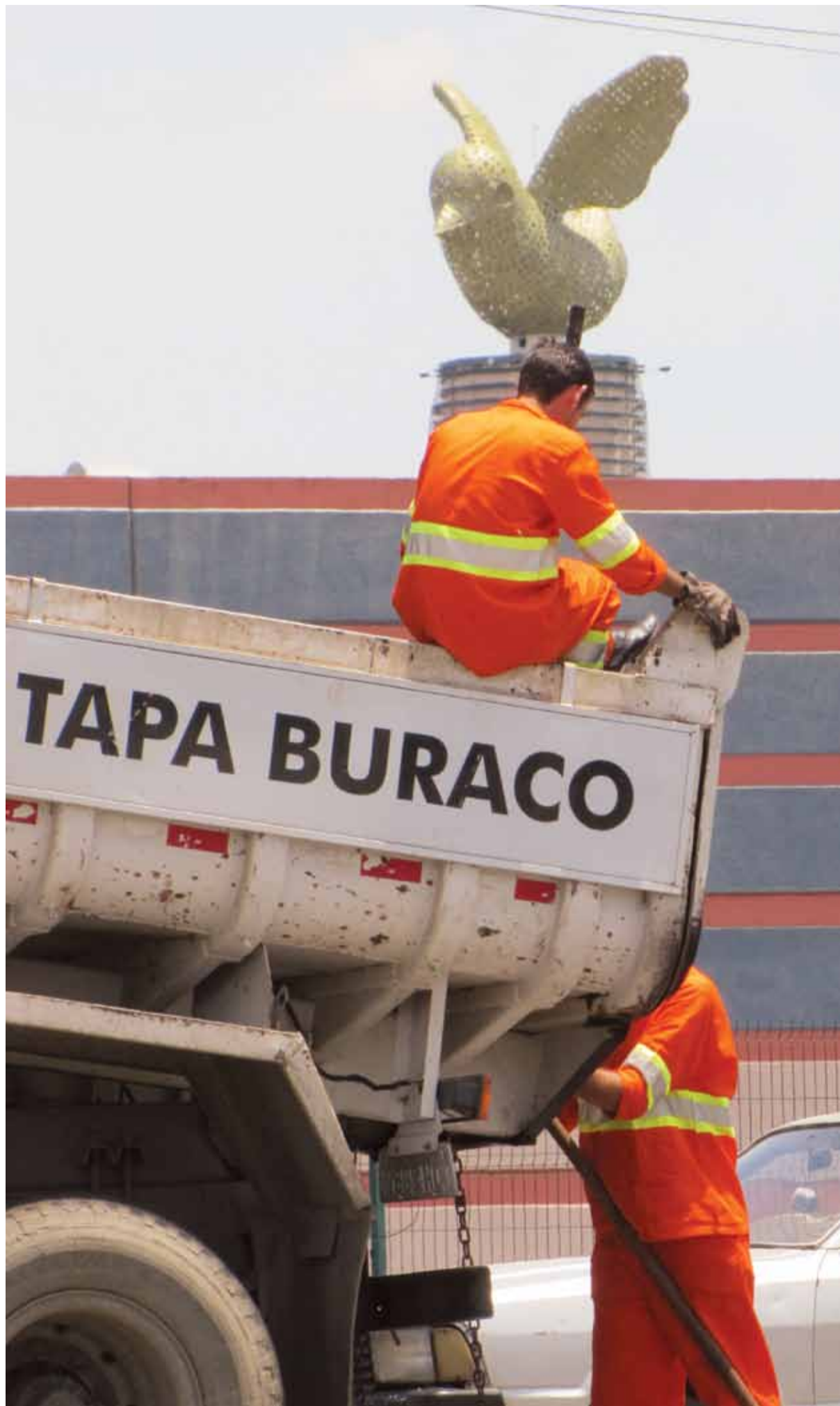
Serviço de tapa-buracos é terceirizado pela prefeitura

ANUNCIE (19) 3256-9059 www.jornalaltotaquaral.com.br