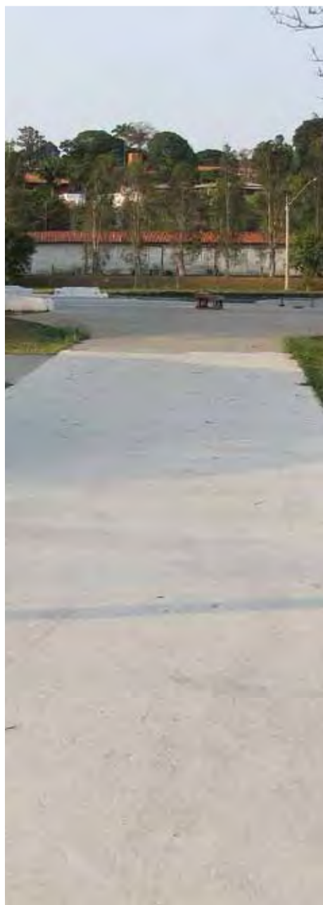
Concreto e asfalto estão tomando lugar da grama