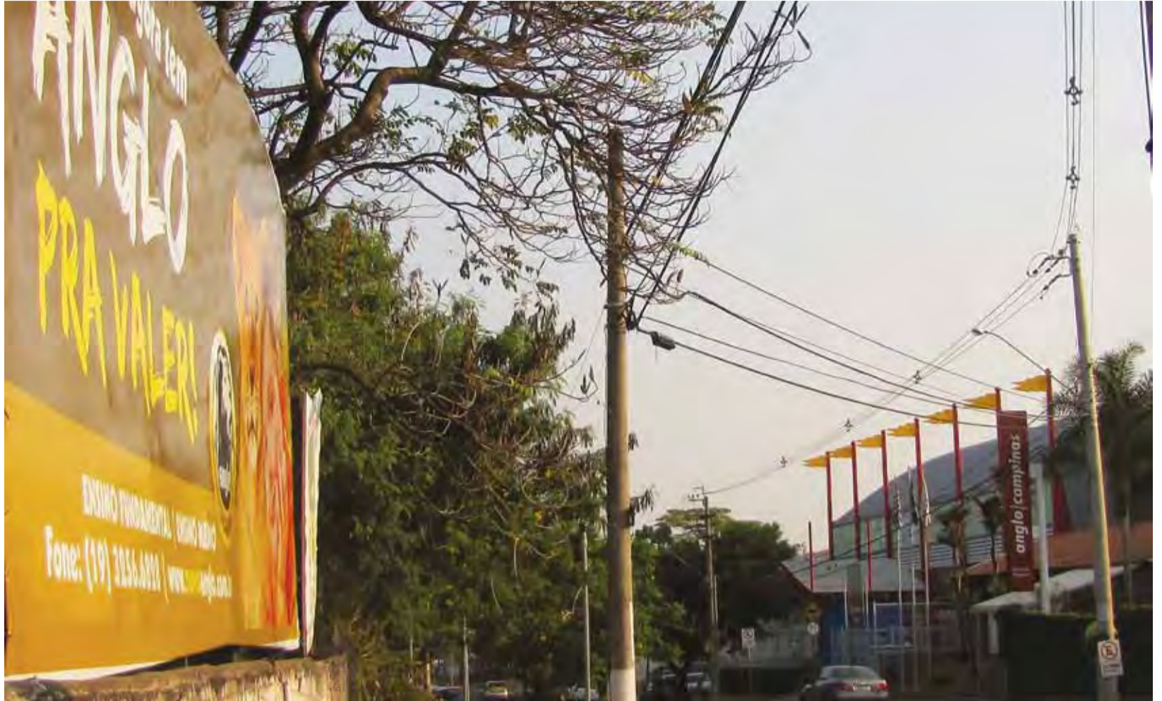
Impossível não ver: marketing mais do que agressivo do sistema Anglo de Ensino instalou outdoor na Rua Jorge Figueiredo Corrêa, praticamente na porta do Anglo/Campinas/COC

E isto ainda não é tudo. Como o mercado do ensino privado no Brasil funciona como mina de ouro, grupos que até então não investiam decidiram participar dele de forma significativa. Isto levou o Grupo Abril - da Editora Abril - de Victor Civitta a assumir o controle do Sistema Anglo de Ensino desde meados do primeiro semestre, o que deve provocar novas mudanças.