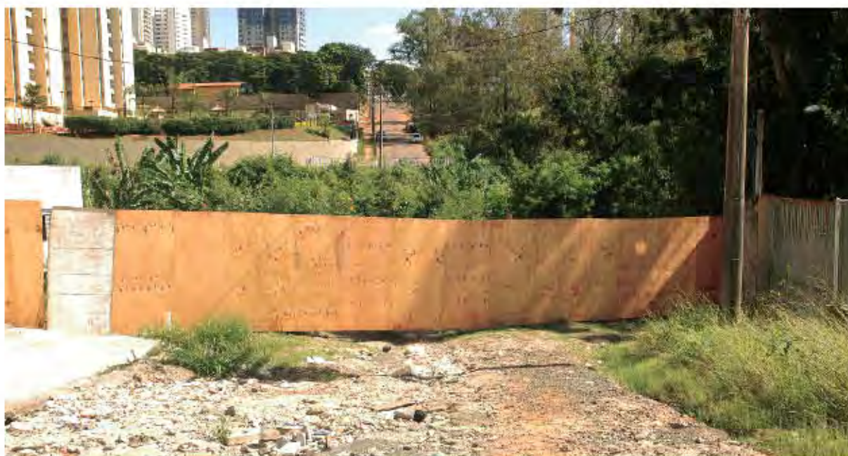
SOL COM A PENEIRA - Prefeitura esconde buracão com esgoto a céu aberto na Hermantino Coelho com tapume. Mas o cheiro...

Ele concorda que "aquele é um ponto crítico e prioritário