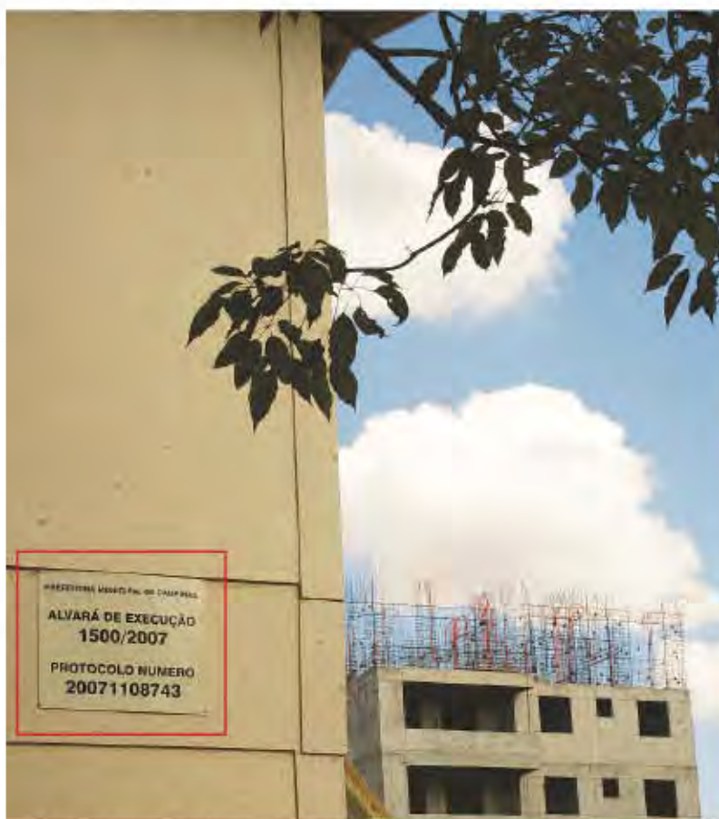
NA PLAQUINHA - Alvará de execução 1500/2007 - Protocolo Número: 2007118743

Localizado na rua Almeida Garret (Taquaral), o empreendimento que já comercializou mais de 70% das unidades foi