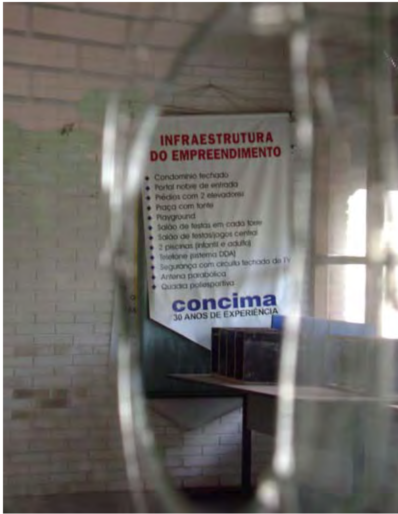
Escritório da Consima, abandonado no Condomínio Primavera

A Consima Incorporadora Construtora Ltda. (anteriormente Concima S/A Construções Cíveis), entregou no dia 30 de março um relatório com levantamentos preliminares que embasam o Plano de Remediação para as áreas contaminadas do bairro Mansões de Santo Antônio. A Cetesb avalia tecnicamente as conclusões do relatório e dará um parecer até meados de maio. Se for confirmada a inexistência de um bolsão de produtos em fase livre alimentando a contaminação, como indicam as análises preliminares, a Prefeitura irá rever o decreto que impede obras na região e poderá finalmente liberar os habite-ses dos moradores do Condomínio Parque Primavera.