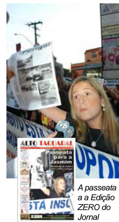
A passeata a a Edição ZERO do Jornal