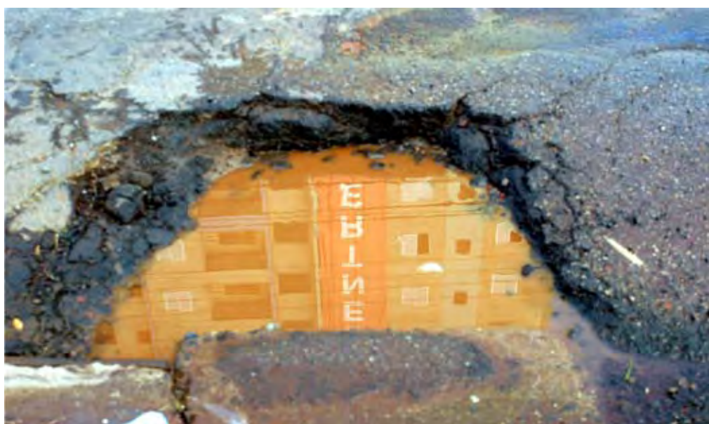
Há um ano, Buraco na Adelino Martins «convida» ao perigo motoristas e pedestres

Em plena rua Adelino Martins, por onde transitam coletivos para Pucc e Unicamp buracos aniversariam com o jornal e atormentam motoristas e pedestres - PÁG. 3 Na rua Hermantino Coelho, chuvas abrem cratera onde o esgoto, em cascata, inferniza a vida dos moradores com o mal cheiro insuportável. Ponte deve resolver o problema - PÁG. 4