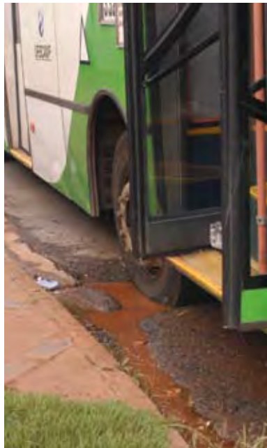
Roda no buraco

O buraco, já passou por vários reparos, mas todos foram feitos sem o devido cuidado e mesmo sem chuva, ele ressurge em pouco tempo.