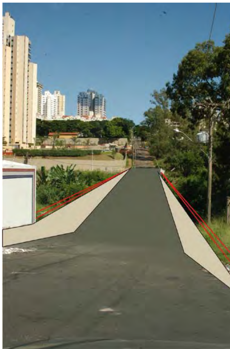
Na foto montagem, um desenho de ponte sobre o córrego que cruza a rua Hermantino Coelho