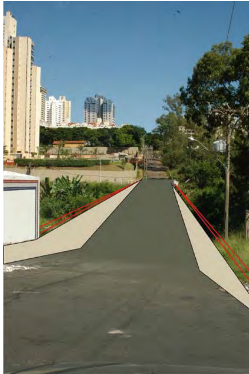
Na foto montagem, um desenho de ponte sobre o córrego que cruza a rua Hermantino Coelho

Em 2004 o Conselho recebeu novamente o pedido de pavimentação das ruas de terra e a construção das duas pontes restantes, além da rede de esgoto da região. “Não conseguimos as obras viárias solicitadas sob a acusação de sermos ricos e não precisarmos de nada pelos demais conselheiros”, lembra Cohen. Mas naquele ano